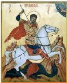
Paroisse Saints-Georges D'Alep