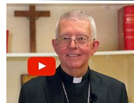
Monseigneur Guy de KERIMEL Nouveau Archevêque de Toulouse

https://www.youtube.com/watch?v=r5DG70nihGE&t=203s